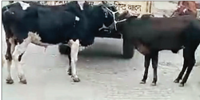
गुहला चीका। सड़क पे खड़ी बेसहारा गाय।