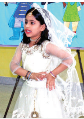
टैलेंट हंट में भाग लेती छात्रा

दर्शन अकादमी 5, माइल, अंबाला रोड, कैथल में टैलेंट हंट करवाया गया। इस आयोजन में विद्यार्थियों ने बड़ चढ़कर हिस्सा लिया। इस आयोजन का मुख्य उद्देश्य विद्यार्थियों में प्रत्येक प्रतियोगिता व गतिविधियों के लिए आत्मविश्वास, निर्भयता, जोश व प्रतियोगी भावना का विकास करना था। इस टैलेंट हंट में म्यूजिक, डांस, पब्लिक स्पीकिंग, मिमिक्री, कमेडी जैसे विषयों को चुना गया, जिसमें स्कूल के विद्यार्थियों ने अपनी रोचकता व अभिरुचि के अनुसार विभिन्न विषयों को चुना। छात्रों ने डांस व म्यूजिक में विभिन्न प्रदर्शनों के लोकगीतों व लोकनृत्यों का बेखूबी प्रदर्शन किया। सभी प्रतिभागियों ने