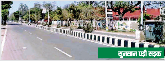
सुनसान पड़ी सड़क

मई माह की शुरुआत में ही अधिकतम तापमान 36 डिग्री से 40 डिग्री तक पहुंच रहा है। दोपहर को हालात ऐसे थे कि सड़कें व बाजार सुनसान नजर आए और हालात कर्पूर जैसे दिखाई दिए। हालांकि इस समय गेहूं की कटाई पूरी तरह से हो चुकी है और किसान खेती से आराम फरमा रहे हैं। इस समय अगर बारिश होती है तो नरमा फसल उत्पादक किसानों के लिए लाभकारी होगी। दिन की तेज गर्मी के कारण लोग कई बार ठंडी चीजों का सेवन कर रहे हैं वहीं रात को तापमान में ठंडक होने के चलते लोग गरम चीजों का सेवन कर लेते हैं। जिससे शरीर की तासीर बिगड़ रही है।