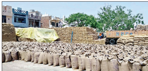
उचाना। मंडी में फड़ पर लगे गेहूं के बैगों के स्टैक और उठान का कार्य जारी।

अब तक किया है। रफ्तार हैफेड ने 139500 क्विंटल का उठान कर 56 प्रतिशत गेहूं के बैगों का उठान किया है। शनिवार को मंडी से दोनों एजेंसियों द्वारा 70 हजार गेहूं के बैगों का उठान किया। मार्केट कमेटी सचिव संदीप कासनिया ने बताया कि छात्र सब यार्ड में डीएफएससी ने 71523 क्विंटल, हैफेड ने 545601 क्विंटल, हैफेड ने 545601 उठान होना बाकी है। 68 प्रतिशत