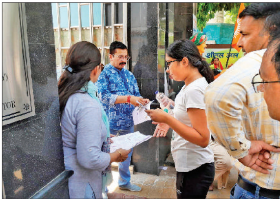
जींद। परीक्षार्थी की जांच करते हुए पुलिसकर्मी

जिले में नीट यूजी परीक्षा के लिए पहली बार परीक्षा केंद्र बनाए गए हैं। पूर्व में नीट की परीक्षा के लिए