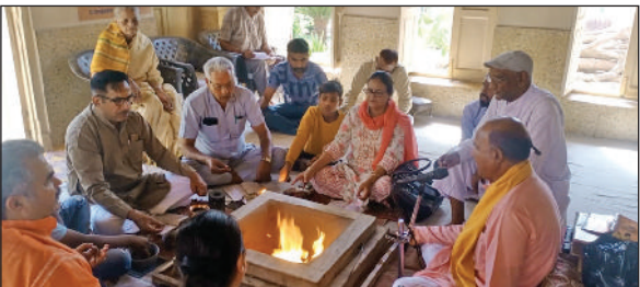
नरवाना। हवन करते हुए आर्य समाज।