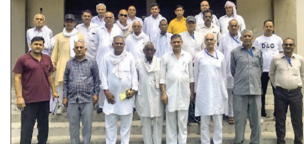
कैथल। बैठक उपरांत बाहर आते पूर्व सैनिक वेलफेयर एसोसिएशन के पदाधिकारी

पूर्व सैनिक वेलफेयर एसोसिएशन जिला कैथल ने हनुमान वाटिका में मासिक मीटिंग की। उसमें सभी पूर्व सैनिकों ने अपने विचार रखे और उसके बाद 10 मई 2024 को सिरसा से चलकर 26 जुलाई को कारगिल वर मेमोरियल लड़ाख पहुंचने वाली कारगिल विजय तिरंगा रथ यात्रा जो की जिला कैथल में भी लगभग 70 किलोमीटर का रूट तय करेगी उसके बारे में सभी साथियों ने बैठकर विचार विमर्श किया साथ ही