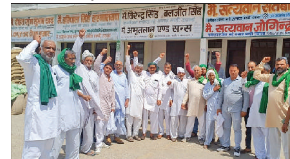
जींद। रोष जताते हुए भाकियू कार्यकर्ता।

भारतीय किसान यूनियन की उचाना में बैठक हुई। जिसमें जींद जिले के अलग-अलग किसानों के मुद्दों पर चर्चा की गई। सरकार द्वारा किसानों पर किए अत्याचार और चुनावी माहौल को देखते हुए फैसला लिया गया कि भाजपा व जजपा नेताओं के गांव में आने पर सवाल किए जाएंगे। सरकार द्वारा किसानों पर चलाई गोलियों व लाठीचार्ज में व लखीमपुर के किसानों को गाड़ों से रौंदकर शहीद किए किसानों व