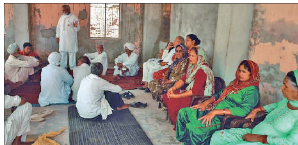
नरवाना। लोगों को भाजपा हराओ देश बचाओ के बारे में बताते हुए।