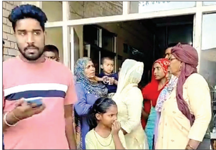
सफीदों। नागरिक अस्पताल में जुटे परिजन।

गांव खेड़ा खेमावती का नवीन दोपहर को अपने घर से खेलने के बात कहकर निकल गया था। इस दौरान मां ने रोका भी कि वह दोपहर में ना जाए लेकिन वह नहीं माना और घर से चला गया। वह घर से खेलने की बजाए सफीदों के रेलवे स्टेशन पर चला गया और वहां पर खड़ी मालगाड़ी पर चढ़ गया। जैसे ही वह मालगाड़ी