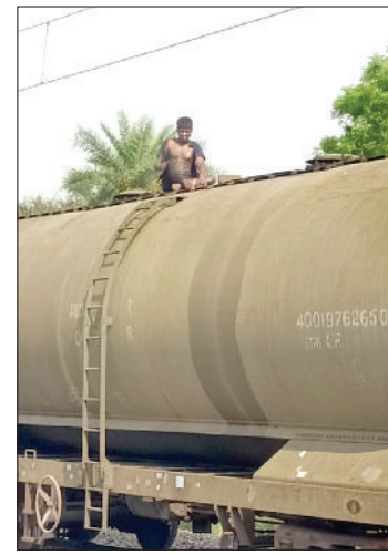
सफीदों। मालगाड़ी के डिब्बे पर चढ़ा युवक।

नागरिक अस्पताल में दाखिल करवाया। मामले की सूचना पुलिस व परिजनों को दी गई। सूचना पाकर गांव खेड़ा खेमावती से परिजन अस्पताल पहुंचे। वहीं नागरिक अस्पताल में प्राथमिक उपचार देकर उसकी गंभीरवस्था को देखते हुए उसे पीजीआई रेफर कर दिया गया। समाचार