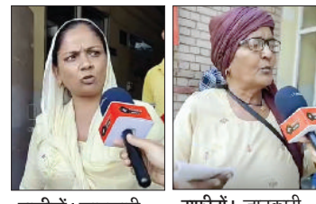
सफीदों। जानकारी देते हुए युवक की मां।