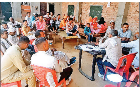
जींद। मजदूर भवन में बैठक करते हुए मजदूर।