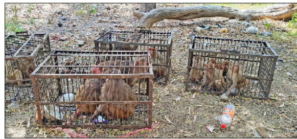
राजौंद। बंदरों को पकड़ने के लिए पहुंची टीम।

नगर में बंदरों को पकड़ने आई टीम से लोगों ने राहत की सांस ली। रविवार को राजौंद के विभिन्न वाडों में बंदर पकड़ने के लिए पहुंची टीम ने 50 से 60 बंदरों को पकड़कर कालेसर यमुनानगर के जंगलों में छोड़ने के लिए ले जाया गया है। पिछले लंबे से वाडों के लोग बंदर पकड़ने के लिए नगरपालिका प्रशासन से गुहार लगा रहे थे। वाडों के लोगों ने बताया कि बंदरों को लेकर आए दिन घटना हो रही थी। जिससे अब बंदरों के हासिले इतने